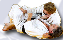
Dégagement de jambe