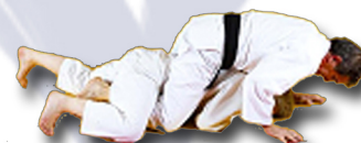
Retournement à cheval