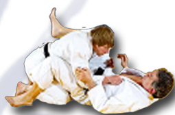
Reprise d'initiative entre les jambes du partenaire