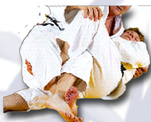
Je sais défendre : ciseaux, plat ventre, ponter